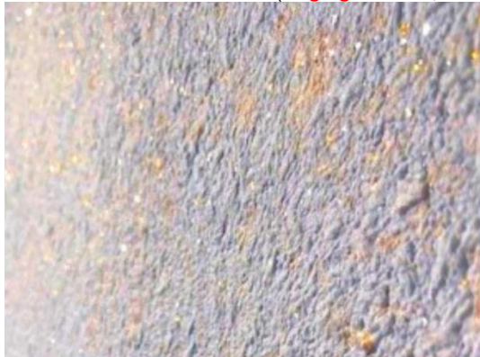
Echantillons gratuit sur demande

** Consommation en habitation ( vaigrage : env. 2,5 m 2 / sachets )